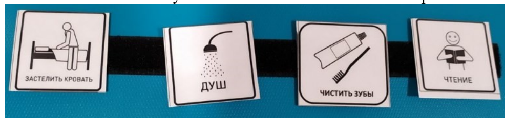
Рис.2 Расписание дня с карточкой «Чистить зубы»